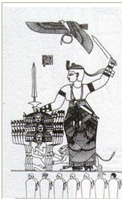
La reine Candace AMANISHAKHETE terrassant ces ennemis

On retrouve ainsi à travers les titres sacrés ( Sa-Ré, Neb-tawy et n-swit-bit ) qui étaient attribués aux reines Candaces des similitudes avec ceux des pharaons égyptiens.