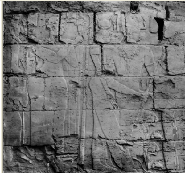
Représentation de la reine Shanakdakhete (170)

La Reine Hatchepsout a fait retracer sur les murs d'un temple d'Amon (pyramide Beg. No 6 de Méroé) qu'elle a fait construire, l'expédition qu'elle avait envoyée à Pount (ville nubienne). On peut y voir la reine candace Aminishakhete dont l'obésité affichée est signe de sa prestance et de son haut rang dans le domaine social et politique.