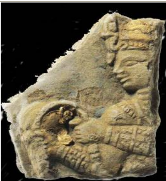
Représentation de la reine Amanishakheto