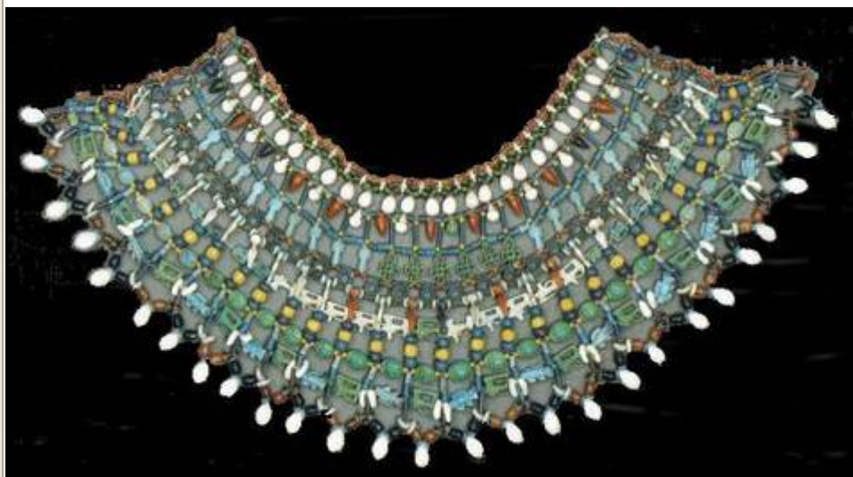
Collier de la reine Amanishakheto (-12 à -2)

Cette société matrilineaire basée sur le culte d'Amon prend toute son ampleur quand Boutana ville située au sud du pays devient son centre névralgique, sa capitale. Ce changement d'état est facilité par une demande grandissante du peuple.