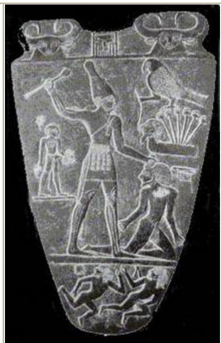
Le roi Narmer terrassant ces ennemis