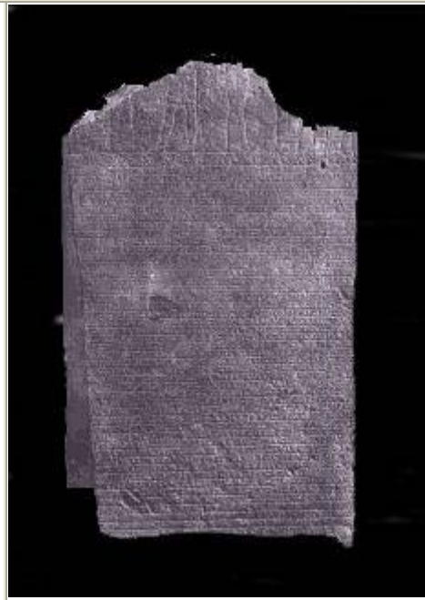
stèle de la reine Amanirenas

La bible aussi nous relate la présence des Candaces. Dans les "Actes des Apôtres" ( chapitre 8 versets 26 à 28) l'apôtre Philippe relate sa rencontre avec un "Éthiopien, homme puissant à la cour de Candace, Reine des éthiopiens, intendant de tous ses trésors qui était venu à Jérusalem (...)"