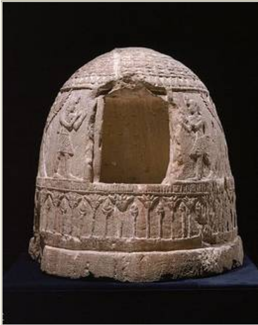
Relique de la reine Amanirenas (-30 à -18)

L'une des Candaces, (Amanishakhete) se retrouva sur les champs de bataille à la tête de son armée, pour repousser César Auguste, envahisseur de l'Égypte et souhaitait en faire autant de l'Éthiopie (Soudan). Le courage et la bravoure de la reine impressionnèrent grandement César. Strabon nous raconte que "César-Auguste donna entière satisfaction à la délégation que la reine Candace lui avait mandatée."